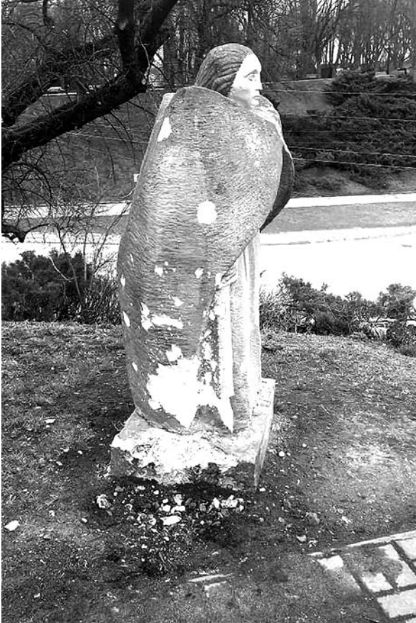
Расстрелянный ангел Чернигова

Когда завывает сирена, жизнь замирает, всё приостанавливается, ничего не работает. Мы возвращаемся из ревущего Чернигова на машине. На трассе спрятаться негде. Надо в себе зажать панику и ехать. И вдруг замечаем пожилых людей, собирающих кукурузу на поле фер-