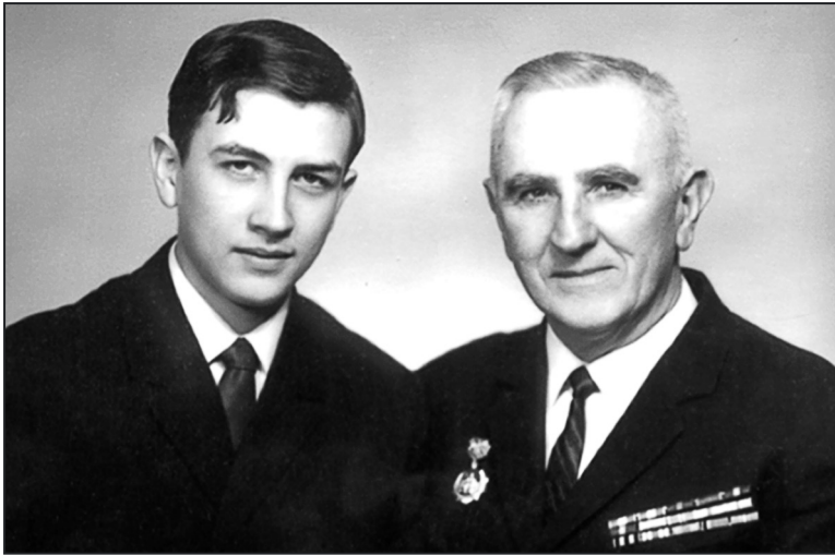
Два Андрея – отец и сын

мало похож на еврея, он мог бы запросто играть в кино старых петербургских чиновников – типичный человек в фуляре. К тому же с противным, скрежещущим голосом.