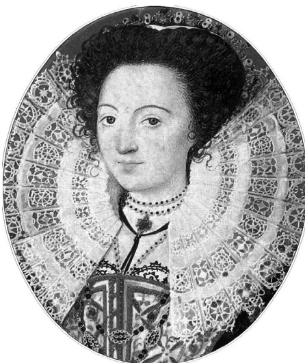
Амалия Ланьер (Бассано)