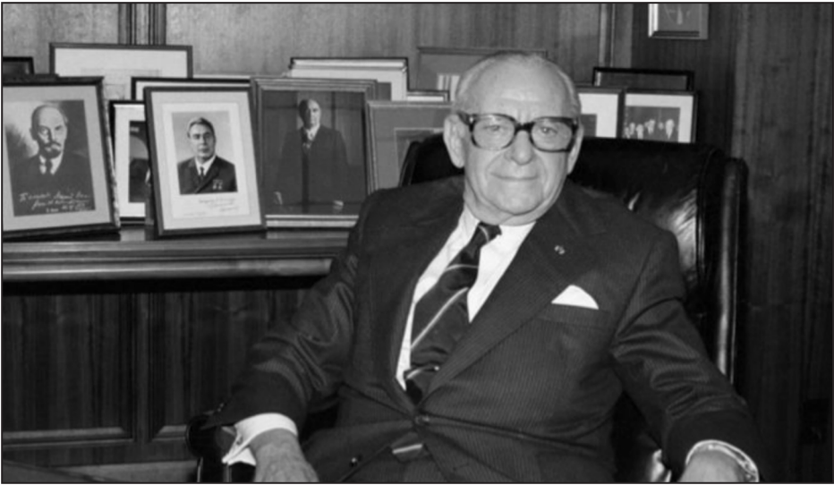
Арманд Хаммер в своём кабинете в Лос-Анджелесе

– Ну а сами вы почему эмигрировали из Советского Союза? Что вам там не нравилось? Думаете, здесь будет лучше?