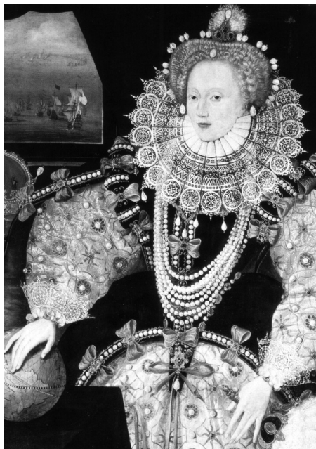
Королева Елизавета I